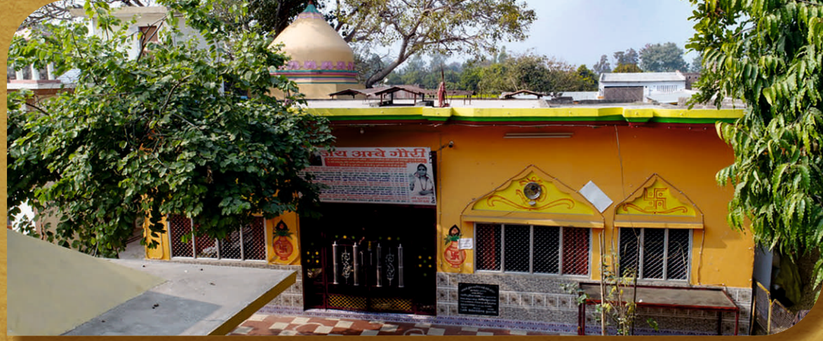
गमा देवी मंदिर, कायमगंज