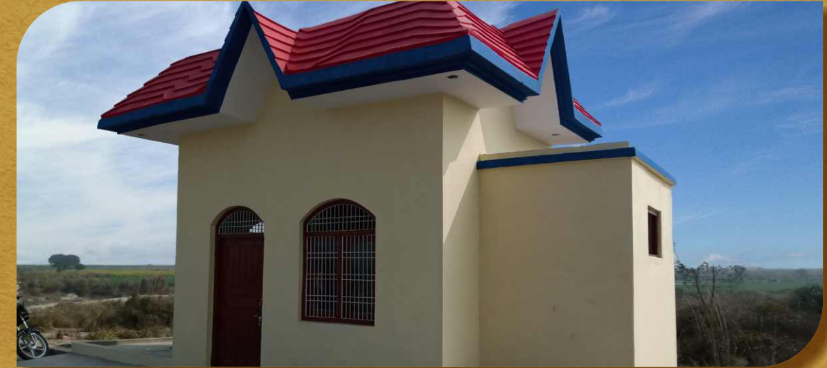
रूम फॉर ट्रेफिक पुलिस, अटैना घाट

पंचाल घाट में फतेहगढ़ मार्ग पर स्वर्ग धाम के नाम से यह शमशान घाट है जहां दूर-दूर से लोग शवों को लेकर दफनाने आते हैं। इस स्वर्ग धाम में सुंदर शमशान घाट का निर्माण कराया गया है व यहाँ लोगों को बैठने एवं रुकने की उचित व्यवस्था की गई है।