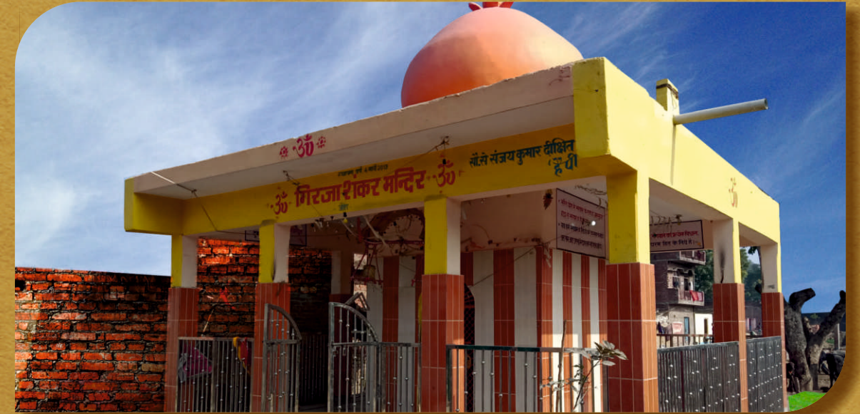
गिरजा शंकर मंदिर, जौरा

संकिसा बौद्ध धर्म की पवित्र स्थली है। यहां भारत के ही नहीं बल्कि अन्य दूर देशों के पर्यटक एवं बौद्ध धर्म धर्मावलंबी आते रहते हैं किंतु वहां उनके उठरने के लिए कोई व्यवस्था नहीं थी। इस कमी को दूर करते हुए वहां विशाल बुद्ध विहार का निर्माण कराया गया।