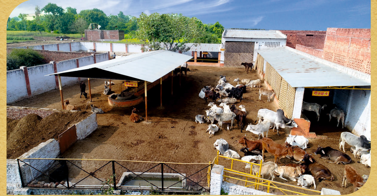
गौशाला गमा देवी मंदिर, कायमगंज

गौ संरक्षण एवं संवर्धन हेतु कायमगंज में गमा देवी मंदिर से लगी हुई भूमि पर गौशाला का निर्माण कराया गया है।