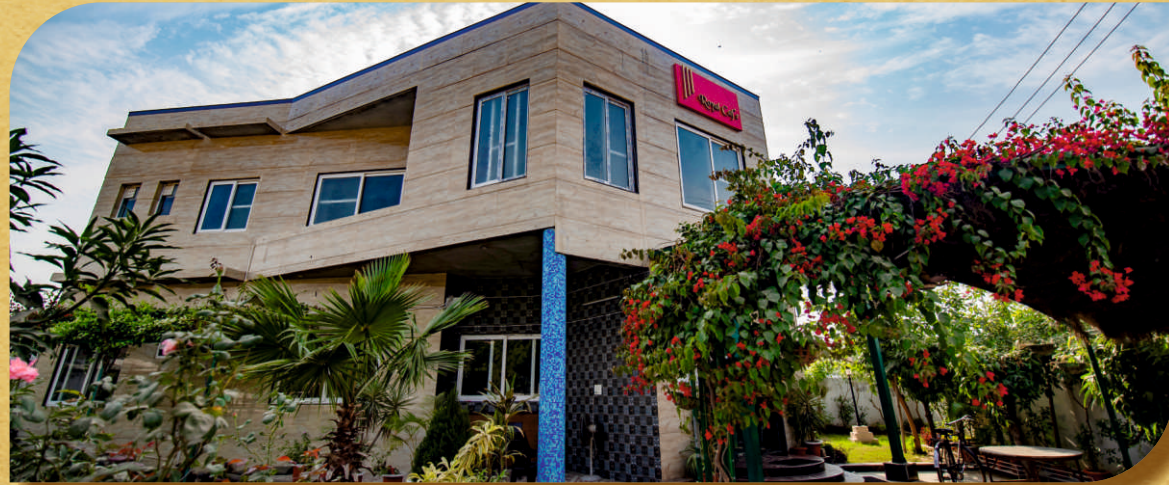
रॉयल कैफे, कायमगंज