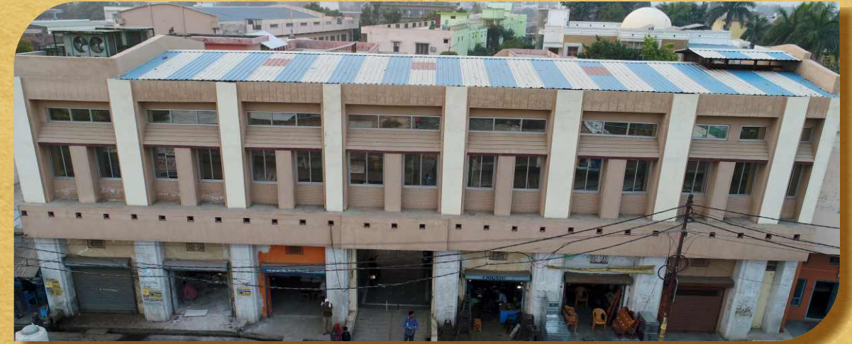
अग्रवाल सभा भवन, कायमगंज

कंपिल महाभारत कालीन इतिहास की प्रसिद्ध नगरी होने के साथ जैन धर्म का भी पवित्र तीर्थ स्थल है व यहां दूर-दूर से लोग आते रहते हैं। किंतु छोटा नगर होने के कारण यहां बाहरी आगंतुकों के ठहरने की कोई उचित व्यवस्था नहीं थी। इस कमी को दूर करते हुए जैन धर्मशाला जैन मंदिर के समीप भव्य धर्मशाला का निर्माण 2008 में कराया गया।