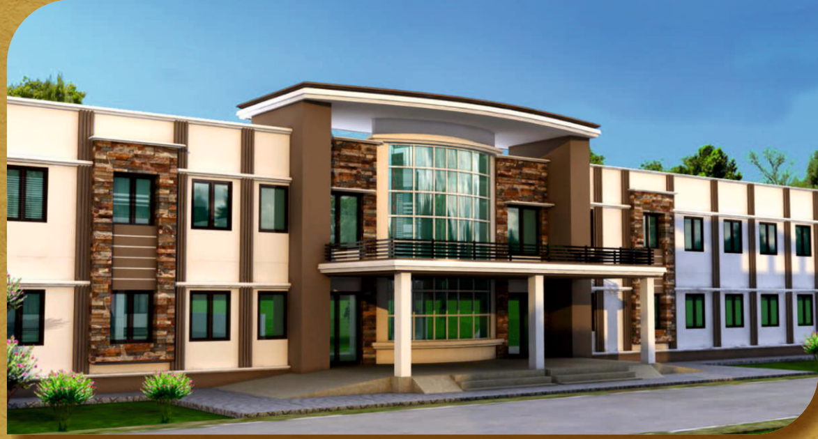
सी०पी० मल्टीस्पेशैलिटी हॉस्पिटल, कायमगंज

कायमगंज क्षेत्र में अच्छे अस्पतालों का अभाव है। बीमार होने पर लोगों को फरुखाबाद या अन्य शहरों में जाना पड़ता है। अच्छी चिकित्सा सुविधा ना होने के कारण यहां के लोग विभिन्न परेशानियों का सामना करते हैं। चिकित्सा सुविधाओं की इस कमी को देखते हुए एक विशाल अस्पताल का निर्माण कराया जा रहा है जिससे कि अब यहां के निवासियों को अपने नगर में ही अच्छी चिकित्सा सेवाएं उपलब्ध हो सकेंगी।