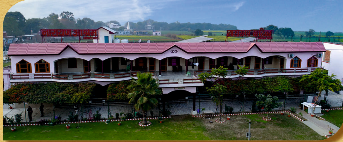
नारायण आश्रम, पांचाल घाट

पांचाल घाट पर मां गंगा के किनारे बाहर से आने वाले संत महात्माओं एवं अन्य श्रेष्ठ जनों के ठहरने योग्य कोई उचित आश्रम नहीं था जिससे बाहरी आगंतुकों को फर्रुखाबाद शहर में रुकना पड़ता था। इस कमी को दूर करने के लिए गंगा के किनारे ही भव्य नारायण आश्रम का निर्माण 2012 में कराया गया यह भव्य आश्रम मां गंगा की गोद में अपने सौंदर्य की बिखेर रहा है।