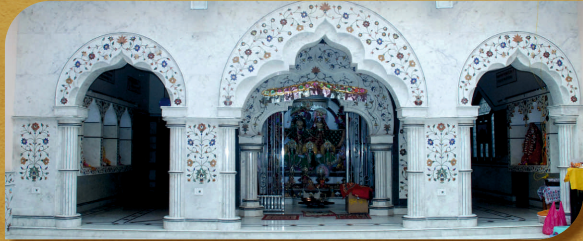
राधा कृष्ण मंदिर, कायमगंज