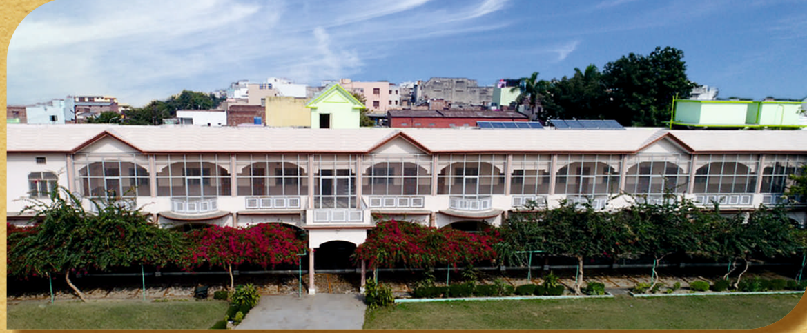
सी०पी० अतिथि गृह, कायमगंज