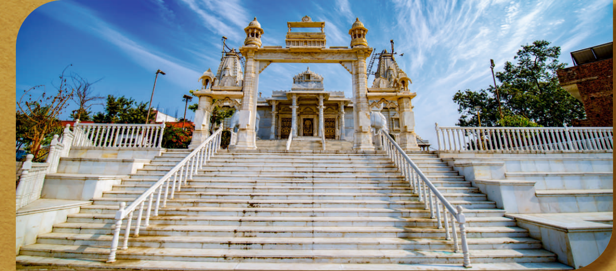
जैन श्वेतांबर मंदिर, कंपिल