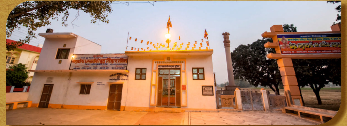
बुद्ध विहार, संकिसा