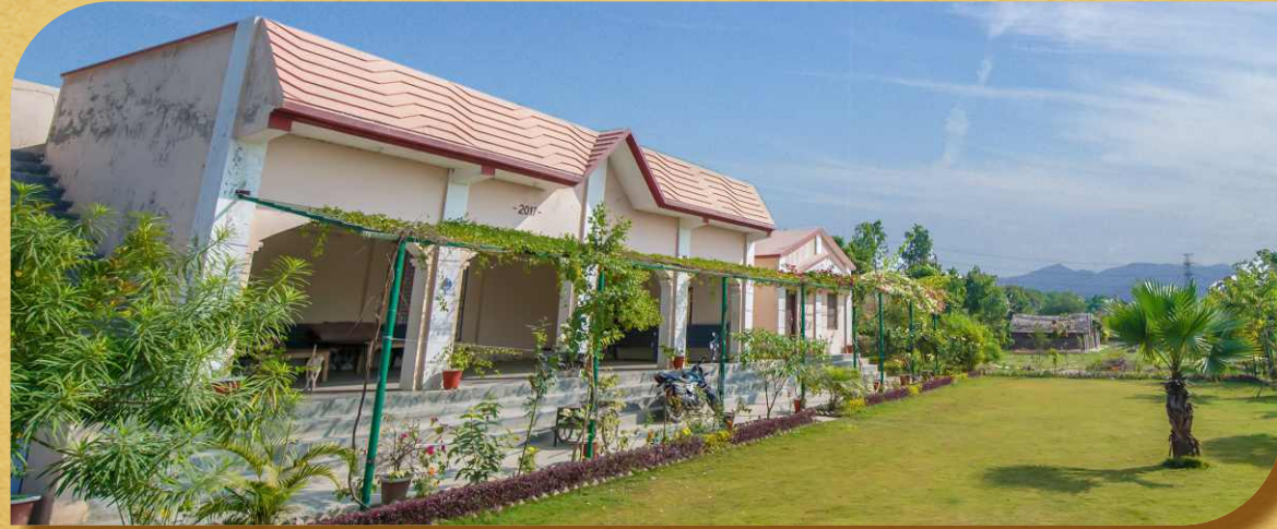
नारायण आश्रम, अटेना घाट

पांचाल घाट पर मां गंगा के किनारे बाहर से आने वाले संत महात्माओं एवं अन्य श्रेष्ठ जनों के ठहरने योग्य कोई उचित आश्रम नहीं था जिससे बाहरी आगंतुकों को फर्रुखाबाद शहर में रुकना पड़ता था। इस कमी को दूर करने के लिए गंगा के किनारे ही भव्य नारायण आश्रम का निर्माण 2012 में कराया गया यह भव्य आश्रम मां गंगा की गोद में अपने सौंदर्य की बिखेर रहा है।